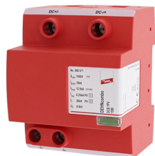
Az ábrák nem kötelező érvényűek