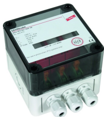
Az ábrák nem kötelező érvényűek