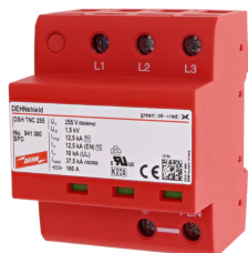
Az ábrák nem kötelező érvényűek