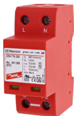
Az ábrák nem kötelező érvényűek