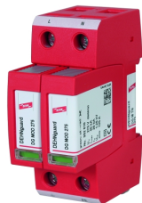
Az ábrák nem kötelező érvényűek